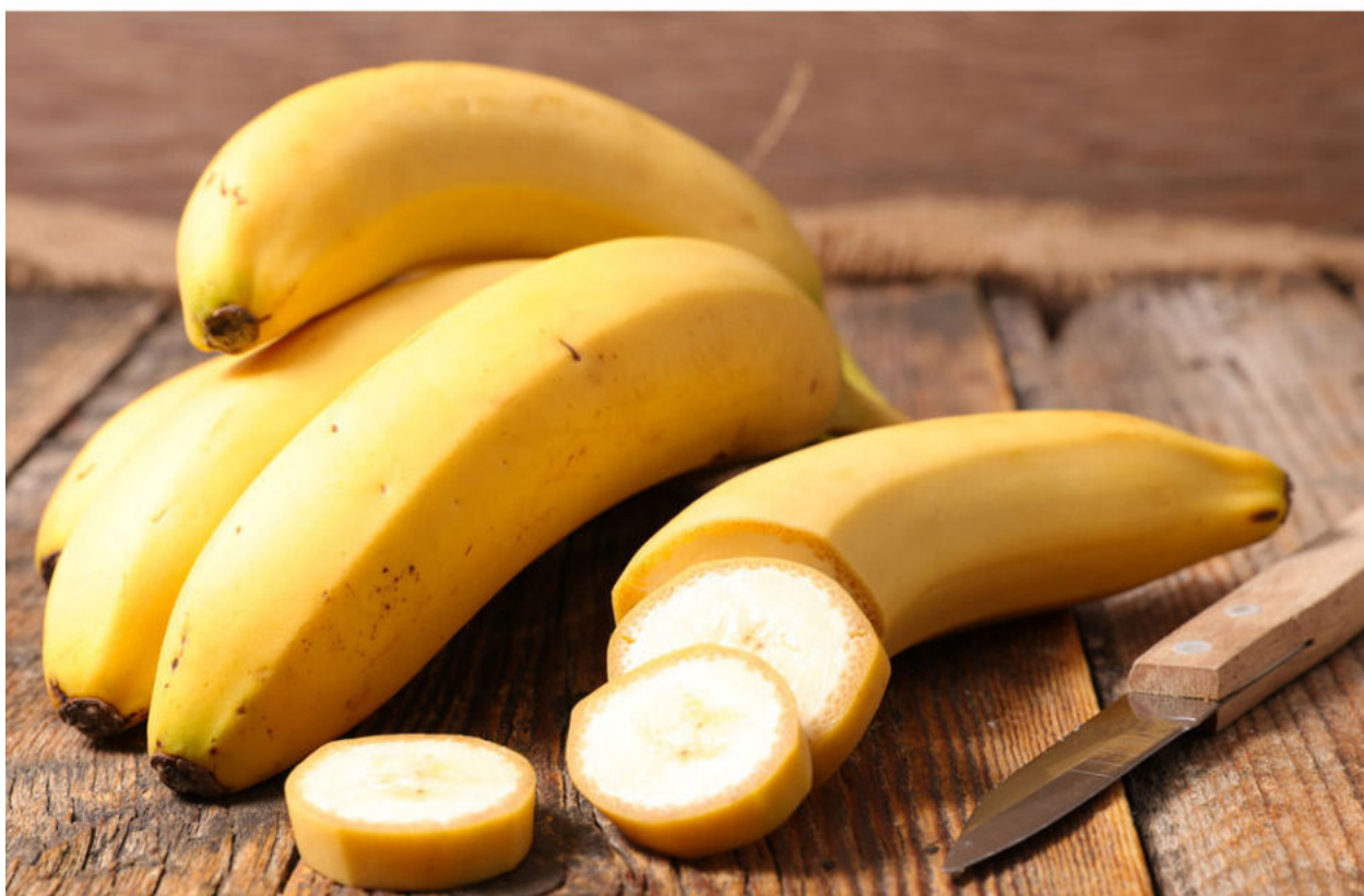
Banaan op hout