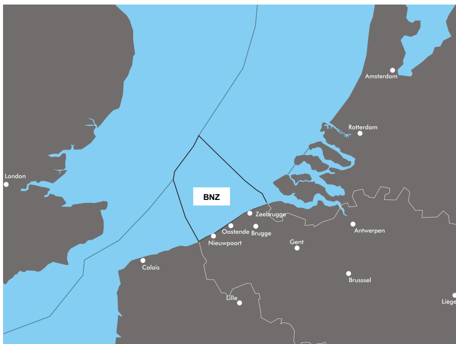
FIGUUR 1: situering van het Belgische deel van de Noordzee, het BNZ

Hoewel de zee duidelijk een doorslaggevende rol speelt in de organisatie en ontwikkeling van elk kust- en deltagebied, plannen we echter al jaren met onze rug naar de zee. De Belgische Atlantic Wall en de Nederlandse Deltawerken zijn daar goede voorbeelden van. Belangrijke economische, sociale en ecologische veranderingen verleggen nu geleidelijk aan onze blik richting zee. Het veelvuldige gebruik en de toekomstige ambities op zee vragen om een plan voor het Belgische deel van de Noordzee (het BNZ).