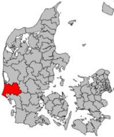
Figuur 3: Varde Kommune