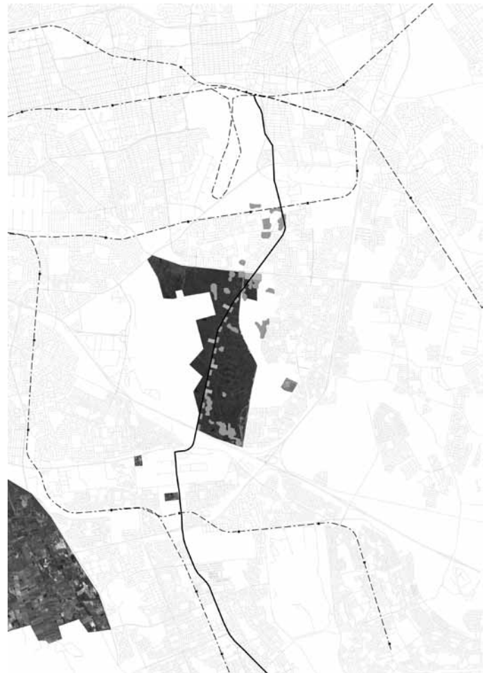
Figuur 2: a) Vacante terreinen in het Bellville Metropolitan Area. De transnet site bevindt zich in de spoorweglus nagenoeg in het midden van het beeld. Bron: kaart Sam Lanckriet, 2010; b) De 'Fake estates' langsheen de loop rond de UWC en Technicon Campus. Kaart: Sam Lanckriet, 2010; c) Het Noord-Zuid traject van de 'Land Line', uitgezet volgens de loop van een bestaande spoorwegbedding. Langsheen dit traject bevinden zich knopen met diverse programma's. Kaart: Daan De Vree, 2010; d) Voorstel voor de ontwikkeling van een Centre for Urban Agriculture van de UWC als satellietcampus tussen de internationale luchthaven en de wijk Delft. Kaart: Daan De Vree, 2010.