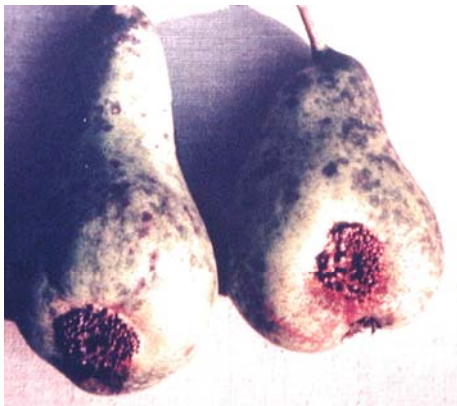
Slika 5. Simptomi bolesti kruškin pikac, na plodovima kruške. (Cvjetković, 1999.)

uslijed čega dolazi do prijevremene defolijacije. Na taj način biljka slabi. Ako se pak zaraza proširi na grane i to jednogodišnje izboje, također se formiraju ecidije i nastaju promjene u obliku rak-rana. Micelij se širi unutar grančica, pa pod utjecajem jakog vjetra ili same težine plodova, grana lako puca. Upravo zbog ovog problema teško se postiže određeni uzgojni oblik krušaka te je ta pojava naročito opasna kod mladih nasada u razvojnoj fazi formiranja krošnje.