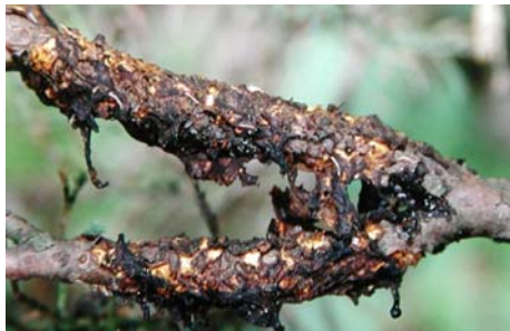
Slika 3. Osušeni teleutosorusi Gymnosporangium fuscum na Juniperusu .

Ciklus razvoja bolesti se potom nastavlja na krušci kao sekundarnoj biljci domaćinu. Simptomi se pojavljuju na lišću u travnju i svibnju. Rijetko se pojavljuju na granama i plodovima, ali ima zabilježenih slučajeva (Cvjetković, 1999).