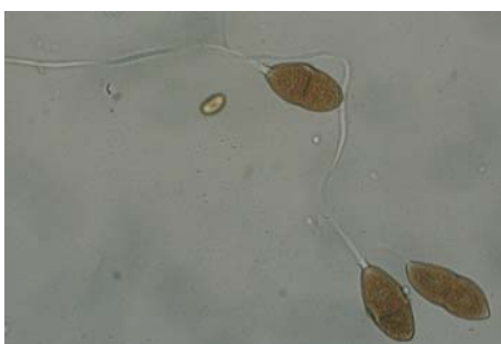
Slika 7. Teliospore Gymnosporangium fuscum

piknid s piknosporama. Nastaje na licu lišća, te je udubljen u tkivo lista. Nazvan u mikologiji kao stadij I. označuje stadij ecidija s ecidiosporama koji najčešće nastaju na naličju lista, a predstavlja zvonoliko tijelo gdje u lancima vise nesporno, jednostanične, blago smeđe ili bezbojne ecidiospore (Slika 6.). Ta boja dolazi od mase spora, pa je i tako jačina boje karakteristika vrste. Stadij III.