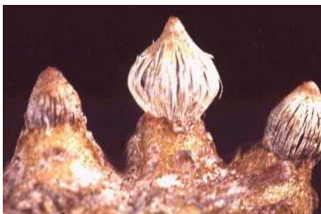
Slika 4. Ecidije s peridiumom

Na mjestu pjega na licu s druge strane, na naličju lista, javlja se hipertrofirano tkivo koje je zapravo stroma na kojoj će se razviti ecidija s ecidiosporama nastala kopuliranjem sada fiziološki različitih (+ i -) spermagonija. Ta zadebljanja poprimaju oblik roščića ili grbastog izraštaja čineći tako otvor ecidije zaštićenog ovojnicom tzv. peridiumom. Nakon što se formiraju ecidiospore, peridium (Slika 4.) uzdužno puca i ecidiospore se raspršuju van poput narančasto-smeđe prašine, prenoseći tako vjetrom zarazu na vrste roda Juniperus , u našem slučaju na Juniperus sabina .