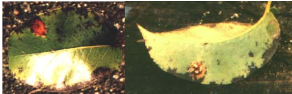
Slika 1. Simptomi bolesti kruškin pikac, na licu i naličju lista kruške

U uvjetima globalnog zatopljenja dolazi do prijelaza nekih mediteranskih bolesti na kontinentalna područja gdje ih ranije nije bilo. Gljivica Gymnosporangium fuscum DC. sinonima Gymnosporangium sabinae Wint. uzročnik je bolesti kruškina pikca ili kruškine hrđe (Slika 1.) sve češće prisutne u kontinentalnom dijelu Republike Hrvatske.