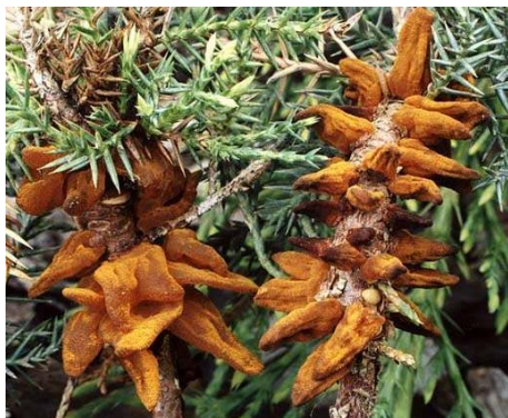
Slika 2. Teleutosorusi Gymnosporangium fuscum na Juniperusu

Gymnosporangium fuscum gljivica i Juniperus sabina u kontekstu bolesti su neodvojivi. Nema potpunog razvoja gljivice u odsutnosti somine i obratno. Kako bi upotpunila svoj ciklus, gljivica zahtijeva dva različita domaćina. Dakle, potpunom razvoju bolesti potreban je i sekundarni domaćin – kruška. Simptomi na Juniperusu , primarnom domaćinu, posve se razlikuju od simptoma na sekundarnom domaćinu kruški. Na Juniperusu simptomi su vidljivi potkraj ožujka i to u vidu žuto-narančastih