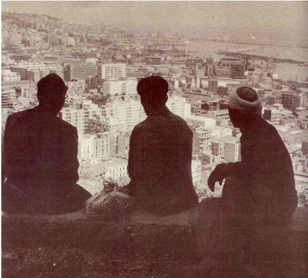
Afb. 1: foto bij het artikel van generaal André Zeller, fotograaf en datum onbekend.

tegenstander was van de onafhankelijkheid en die in het artikel de ruimte krijgt om uit te leggen dat de dekolonisatieoorlog mede was ingegeven door een ideaal 14 , toont Historia Magazine dat de bewustwording van het kolonialisme binnen de redactie nog niet heeft plaatsgevonden. Veel artikelen zijn nog doordrongen van een koloniale ideologie.